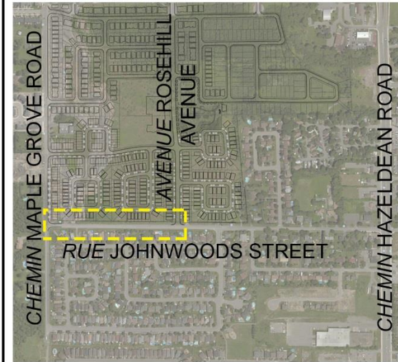
CONTEXT PLAN PLAN CONTEXTUEL