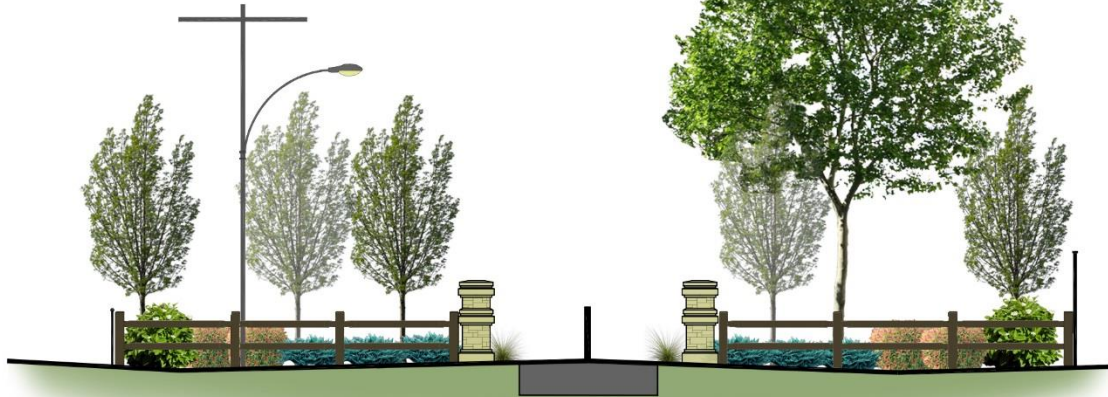
MAPLE GROVE ENTRANCE FEATURE STRUCTURE D'ACCUEIL - MAPLE GROVE

HYDRO CORRIDOR - LOW TREE ZONE COULOIR DE TRANSPORT D'ÉLECTRICITÉ - ARBRES DE FAIBLE HAUTEUR