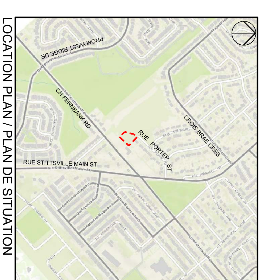
LOCATION PLAN / PLAN DE SITUATION

Le parc William Bradley est un nouveau projet de parc accessible qui sera aménagé sur un terrain en pente douce. Il comportera des aires de jeu actif et passif, un sentier en boucle asphalté et bordé d'endroits pour s'asseoir et pour garer son vélo, une plateforme qui accueillera plus tard une structure d'ombrage, et de nombreux jeunes arbres qui offriront de l'ombre et une barrière visuelle et compléteront le mur végétal existant le long de la propriété au sud-est.